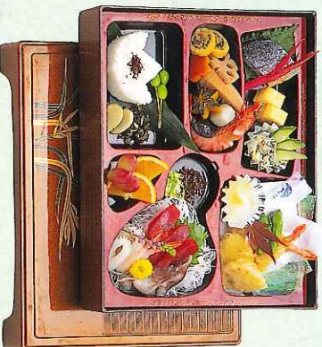
会席膳 6,000円 (吸物付、容器付) (9-09-60)