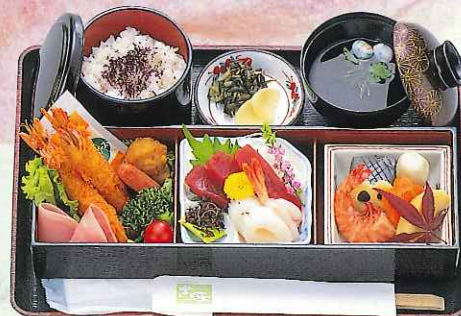
おまかせ膳 2,500円 (9-07-25)