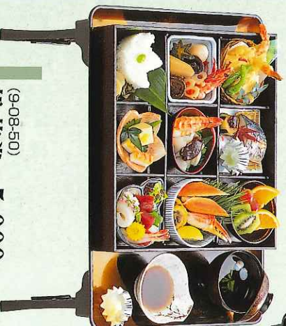
(9-08-50) 松花堂 5,000円