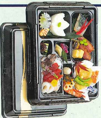
(8-01-40) 会席料理 4,000円 (ハック)