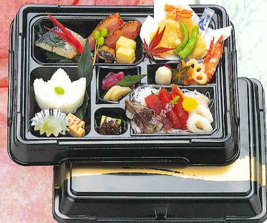
会席料理 4,000円 (パック) (吸物付、容器付) (8-01-40)