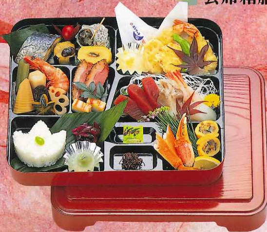
会席料理 5,000円 (パック) (吸物付、容器付) (8-01-50)