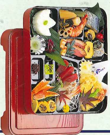
(8-02-50) 会席料理 5,000円 (ハック)