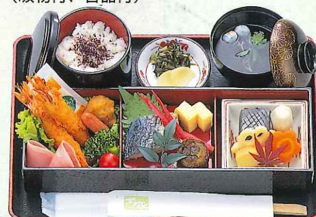
おまかせ膳 2,000円 (9-07-20)