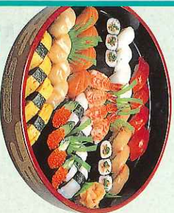
■松 5,000円 (9-04-50)