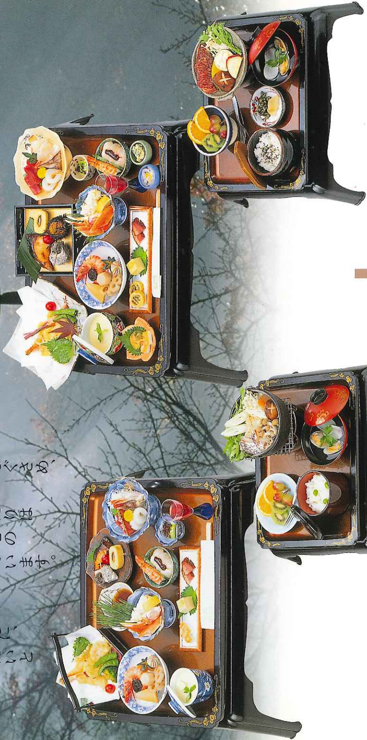
(9-11-100) 御膳会席 10,000円

我が国には古くから故人や先祖をなぐさめ、 偲ぶ心の儀式「法要」があります。 深く生活の中に根ざしたこのしきたりは 生命のつながりを感謝、敬意し、心の よりどころとして、今も生きています。 こうしたしきたりや厳粛な儀式の お手伝いとして、心のこもった 「お慰み料理」を通じ、皆様方と共に、 その霊の平安を祈り、お役に立ちたいと 願っております。 皆様のご利用を心よりお待ち 申しております。