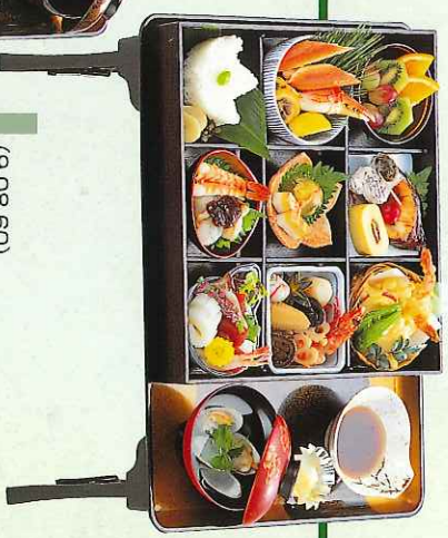
(9-08-60) 松花堂 6,000円