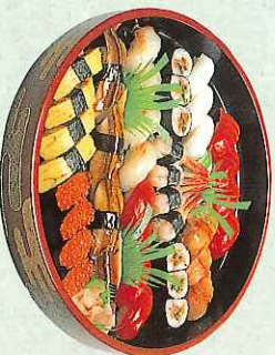
■竹 6,000円 (9-04-60)