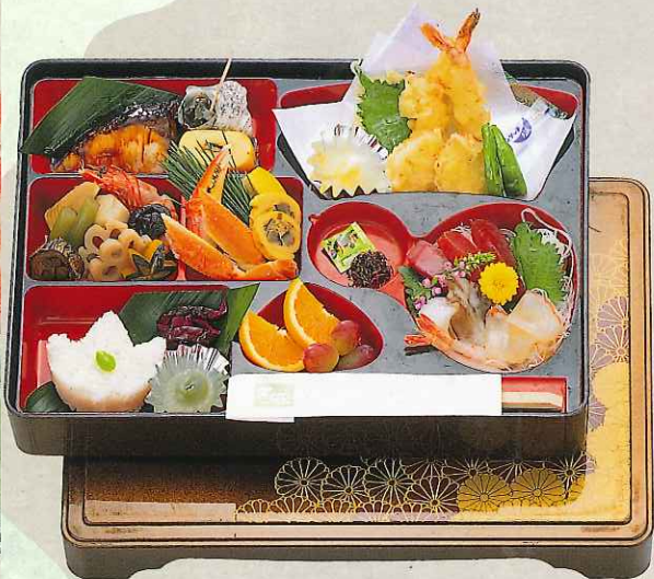
会席膳 6,000円 (容器付) (9-09-60)