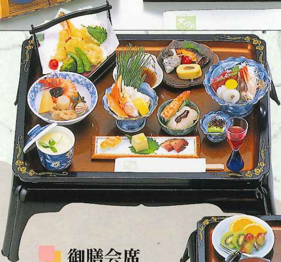
御膳会席 8,000円 (9-11-80)