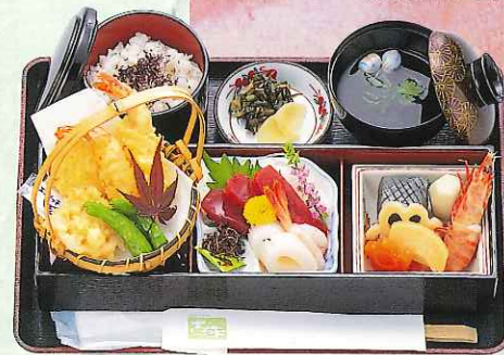
おまかせ膳 3,000円 (9-07-30)