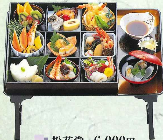
松花堂 6,000円 (9-08-60)