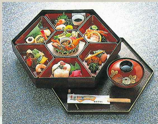
遊食膳 4,000円 (9-10-40)