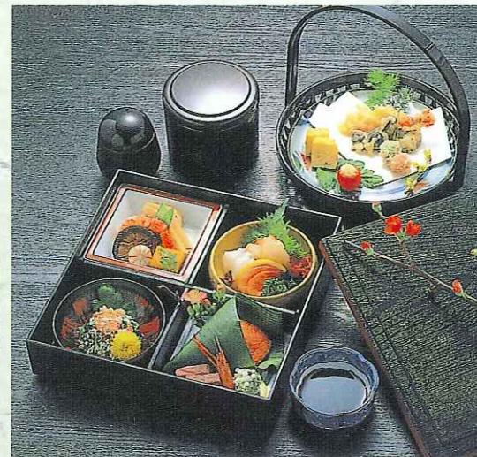
松花堂 2,500円 (9-06-25)