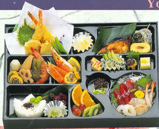
会席箱膳 6,000円 (吸物付、容器付) (8-03-60)