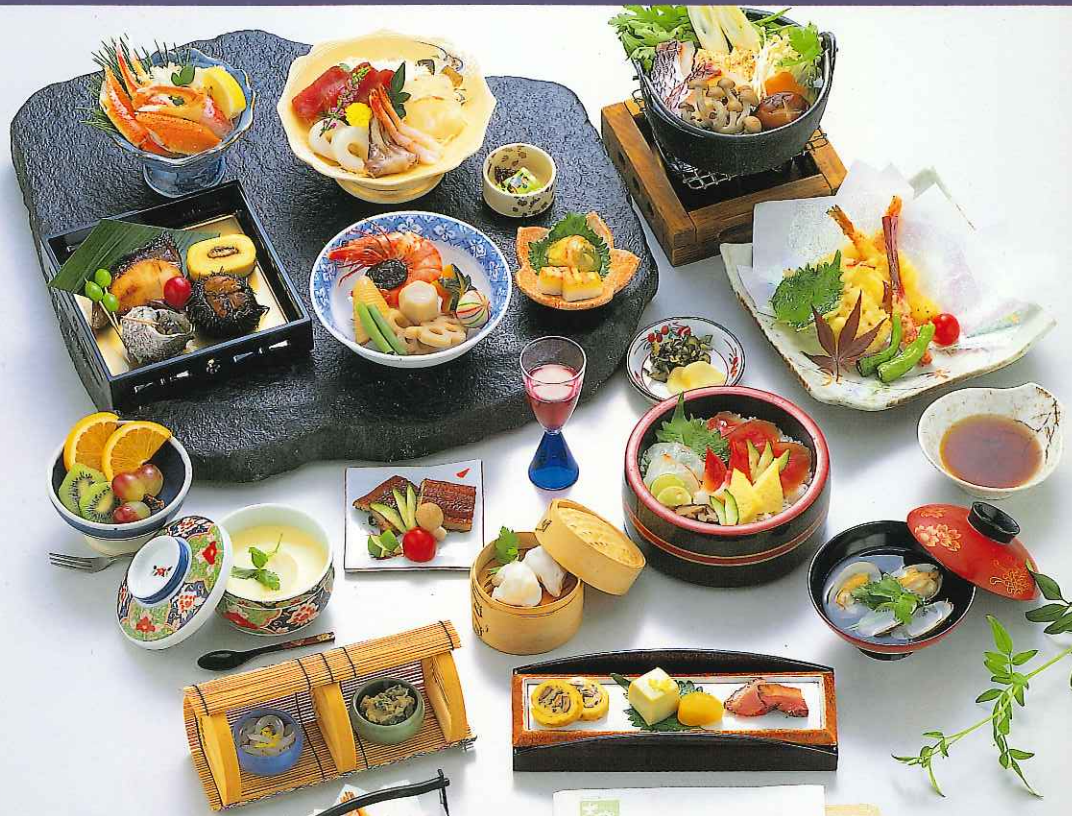
懐石料理 20,000円 (9-11-200)